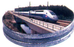
TGV 20 milliards