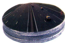
Autoroutes 26 milliards