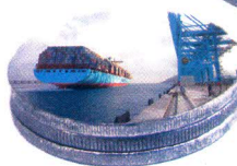
TANGERMED 2 12 milliards